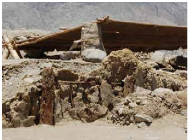
Figura 2. Restos de muros bajareque con más de cuatro mil años de antigüedad. Caral, Perú.

La combinación de fibras de diferentes diámetros, la integración de varas o hasta secciones de troncos, asociada al amarre de estas tramas, ha generado una gama casi infinita de opciones constructivas, cuya estabilidad puede ser milenaria en condiciones geográficas apropiadas y con prácticas mínimas de mantenimiento preventivo. Como una muestra de este hecho destacan las ruinas prehispánicas de la ciudad de Caral en el centro del Perú, donde se han podido fechar estructuras correspondientes al año 2500 a.C. (Shady et. al. , 2009, p.9) en sorprendente estado de conservación (Figura 2).