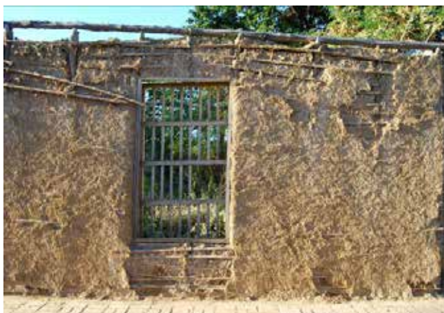
Figura 9. A pesar de décadas de abandono, esta vivienda histórica conserva la integridad de sus muros gracias a la cantidad de paja agregada a la tierra. La Vela, Venezuela.

Asimismo, existe una tradición muy difundida en todo el mundo de agregar estiércol de caprinos, camélidos, bovinos o equinos. Este material, además de incrementar la adherencia de las mezclas por la presencia de materia orgánica en descomposición, incorpora fibras vegetales que han sido trituradas por el ganado y parcialmente digeridas.