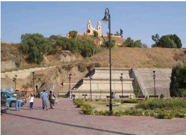
Figura 1. El núcleo de la Gran Pirámide de Cholula fue hecho enteramente de adobe y recubierto por superficies de mampostería de piedra.

Lo mismo en regiones secas que lluviosas, cálidas y frías, las sociedades antiguas aprendieron a adaptar los materiales locales más abundantes para generar espacios habitables y, desde luego, la tierra era un componente permanente. Sin embargo, esta materia prima no siempre es evidente en los inmuebles, por lo que se tiende a pensar que no existe. Esto sucede frecuentemente en el caso de grandes pirámides, como las de Mitla, Monte Albán, Cholula, Tula o Teotihuacán (Figura 1) donde la tierra de los núcleos (generalmente transformada en adobes) era recubierta con piedra y a veces con cal para conferirle mayor durabilidad.