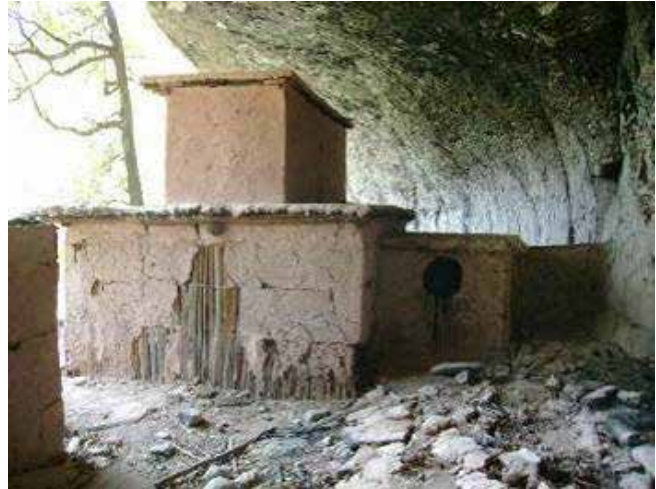
Figura 4. Viviendas prehispánicas de dos niveles, realizadas con secciones de madera, colocadas verticalmente y sujetadas con travesaños atados. Ese entramado se recubría con tierra arcillosa. Cueva del Maguey, Durango.

Cuando la tierra utilizada era demasiado plástica, como consecuencia de la cantidad o tipos de arcilla contenidas, requirió ser estabilizada mediante el