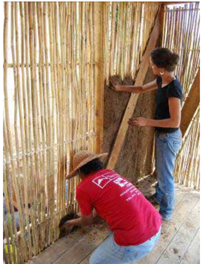
Figura 13. La construcción con bajareque propicia el trabajo colectivo y evita la dependencia tecnológica. Taller de construcción comunitaria. INSO, Oaxaca.

Por otra parte, la esbeltez de las paredes permite un óptimo aprovechamiento de los terrenos de emplazamiento, factor que se vuelve crucial en las zonas urbanas en donde los predios cada vez son más reducidos y el costo por metro cuadrado es más elevado . Es interesante que a pesar de esta limitación en su grosor y la consecuente reducción de masa térmica, el comportamiento del bajareque resulta notablemente adecuado gracias a la combinación de madera, caña, paja y barro; materiales que presentan en su interior acumulaciones de aire que proporcionan aislamiento ante los cambios de temperatura.