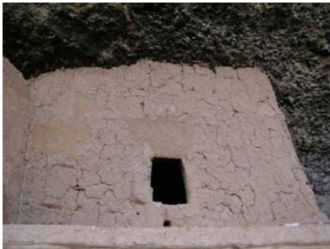
Figura 8. El agrietamiento es la manifestación de la fuerza y actividad de las arcillas que permiten que la tierra se adhiera al entramado de madera. Zona arqueológica de Cuarenta Casas, Chihuahua.

Los materiales fibrosos pueden ser de origen vegetal, como es el caso de la paja de diferentes gramíneas, acículas de pináceas, cáscaras de coco, tallos del maíz, hojas secas de bambú, maguey, agave o henequén (Figura 9). Pero también existen sitios en los que, históricamente, se han empleado fibras de origen animal provenientes de lana de ovejas o cabras, crines de caballo, pelo de llama e, incluso, cabello humano.