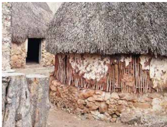
Figura 11. En la vivienda maya predomina el orden vertical de un entramado notablemente abierto para recibir el relleno arcilloso. Luego se recubre con la tierra blanca conocida como sascab y finalmente con cal. Acanceh, Yucatán.

Sus espacios son sumamente confortables para poder soportar las elevadas temperaturas que se presentan en toda la península de Yucatán. Asimismo, se ha podido constatar que la forma absidial de los muros cortos de sus plantas, asociada a la sección semi-cónica de sus cubiertas, provee a estas viviendas de una gran resistencia ante los embates de los vientos ciclónicos que se manifiestan periódicamente.