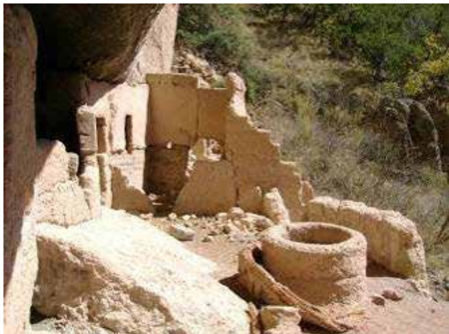
Figura 5. Ruinas de dos niveles en el conjunto habitacional prehispánico. En primer plano se observa la base cilíndrica del cuescomate y restos de las paredes inclinadas que conformaban su recipiente. Cueva arqueológica de Sirupa, Chihuahua.