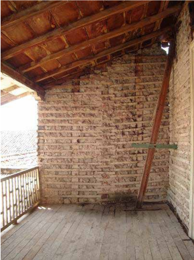
Figura 7. Proceso de restauración de una vivienda histórica de dos niveles, construida enteramente con la técnica de “taquezal”. Granada, Nicaragua.

y las demás eran de madera revocadas de lodo por dentro y fuera y blanqueadas” (Kubler, 1984, p. 154).