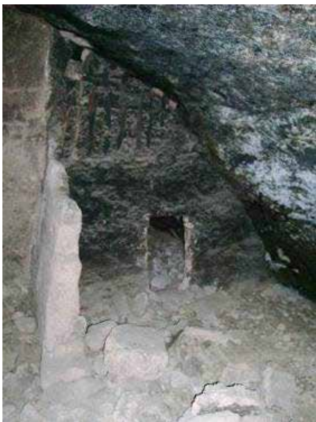
Figura 6. En la parte alta del muro donde se ha perdido el recubrimiento, se observa la retícula de madera que conforma su núcleo. Cueva arqueológica de Sirupa, Chihuahua.

Estas bolas se llevaban hasta el sitio de construcción, lanzándolas de mano en mano a manera de cadena humana y, una vez que los constructores las recibían en la obra, las modelaban en torno a los entramados. Luego, con algunos golpes de mano, o bien, con la ayuda de alguna herramienta, las aglutinaban; con lo que se perdía su forma esférica. No se empleó mortero alguno porque la propia humedad de las esferas era suficiente para aglutinarlas entre sí a la estructura entramada que constituía el bajareque.