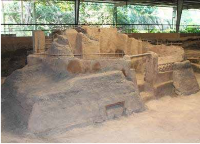
Figura 3. Viviendas arqueológicas en Joya de Cerén, El Salvador.

Parelelamente, en el norte de la República Mexicana y sureste de Estados Unidos, habitaron civilizaciones que supieron aprovechar sabiamente la abundancia de la tierra y la casi total ausencia de cal. Ellos combinaron el manejo de tierras arcillosas con fibras vegetales y secciones de madera para desarrollar culturas constructivas altamente complejas con las que se edificaban muros, entrepisos y techos de estructuras de varios niveles de altura.