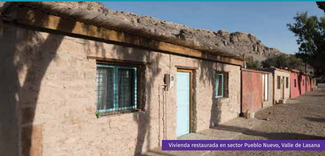
Vivienda restaurada en sector Pueblo Nuevo, Valle de Lasana