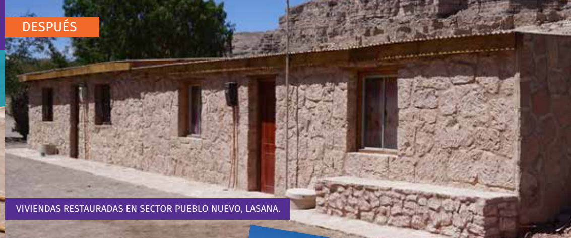
VIVIENDAS RESTAURADAS EN SECTOR PUEBLO NUEVO, LASANA.