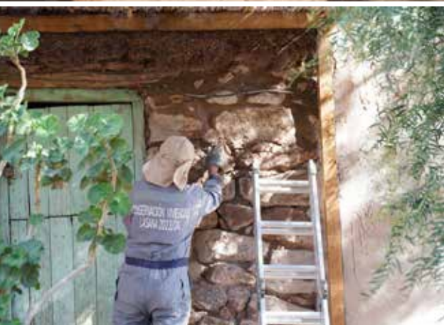
Maestros en obra