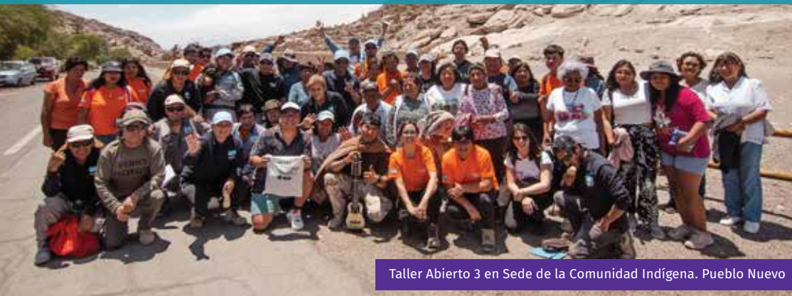
Taller Abierto 3 en Sede de la Comunidad Indígena. Pueblo Nuevo