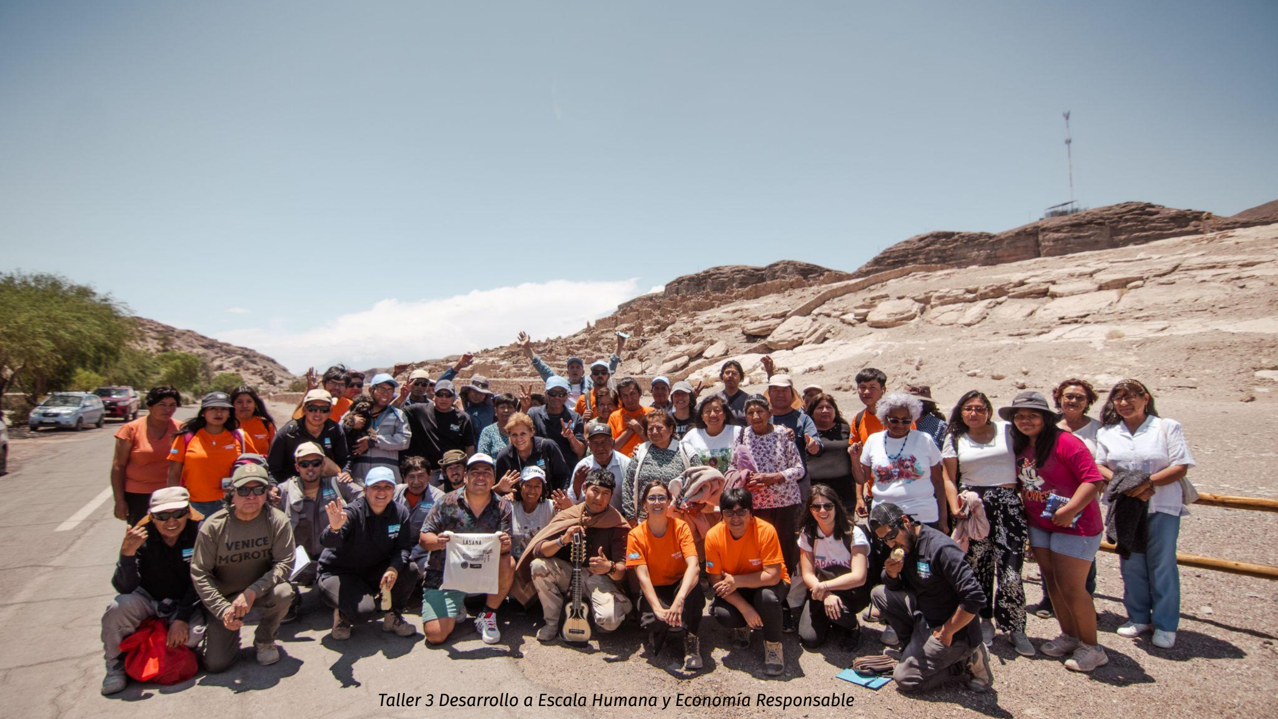
Taller 3 Desarrollo a Escala Humana y Economía Responsable