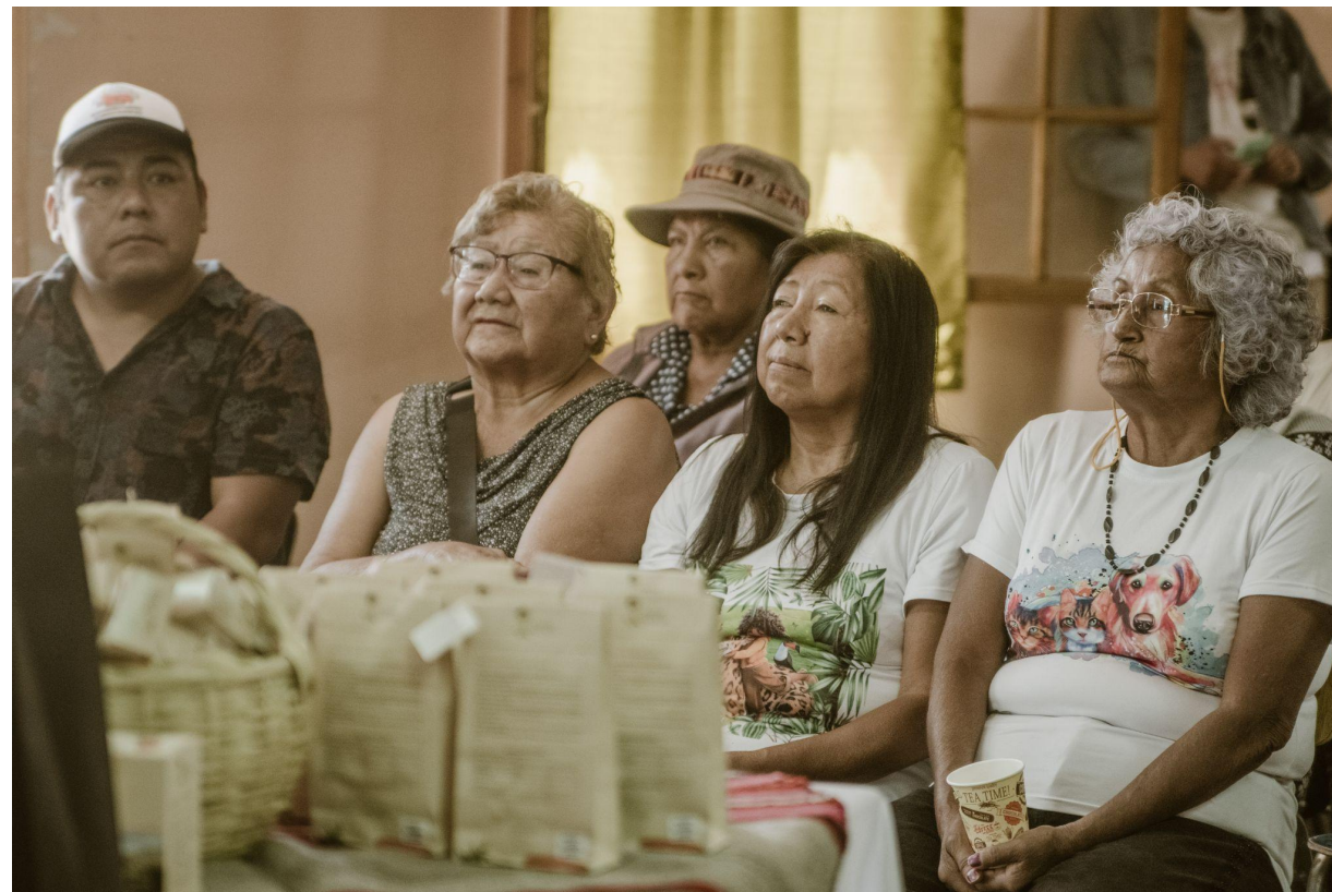
Taller 3 Desarrollo a Escala Humana y Economía Responsable

Lo más relevante es pensar en lograr un ideal manteniéndonos en nuestro territorio sin abandonar nuestra vida rural, logrando mantener tradiciones y costumbres sin alterar el medio. Además de generar recursos individuales que también involucran a los demás comuneros, creando una red de servicios que hagan llegar al turista al lugar y hacerlos partícipes de nuestras vivencias con un servicio completo donde se cubran las necesidades del visitante y a la vez genere recursos para la Comunidad y los particulares bajo la mirada de la conservación y protección.