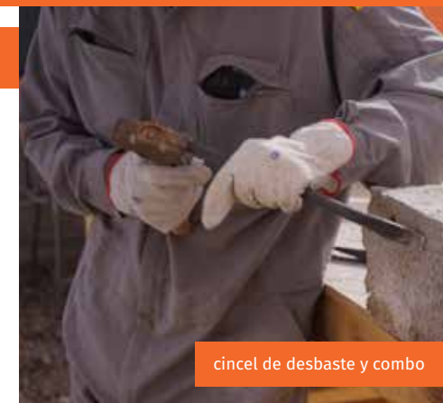
cintel de desbaste y combo