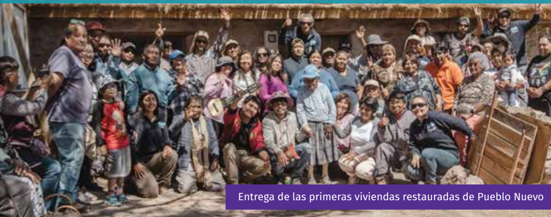
Entrega de las primeras viviendas restauradas de Pueblo Nuevo