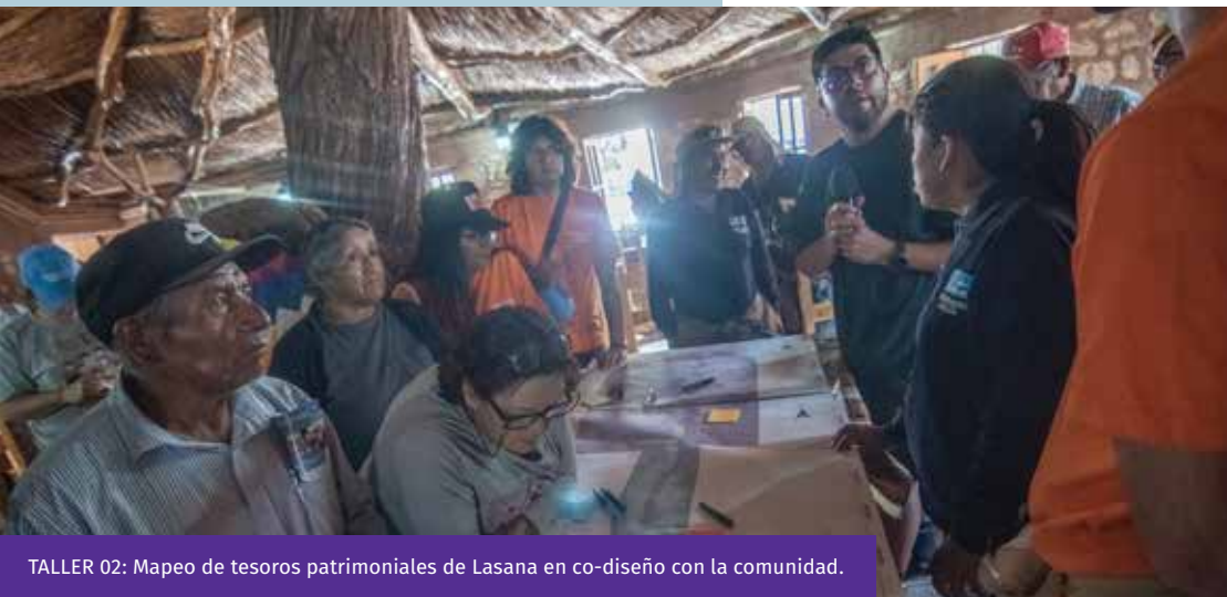
TALLER 02: Mapeo de tesoros patrimoniales de Lasana en co-diseño con la comunidad.