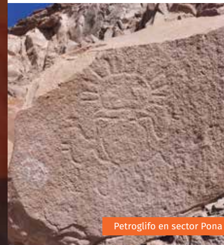
Petroglifo en sector Pona