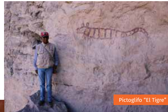
Pictoglifo "El Tigre"