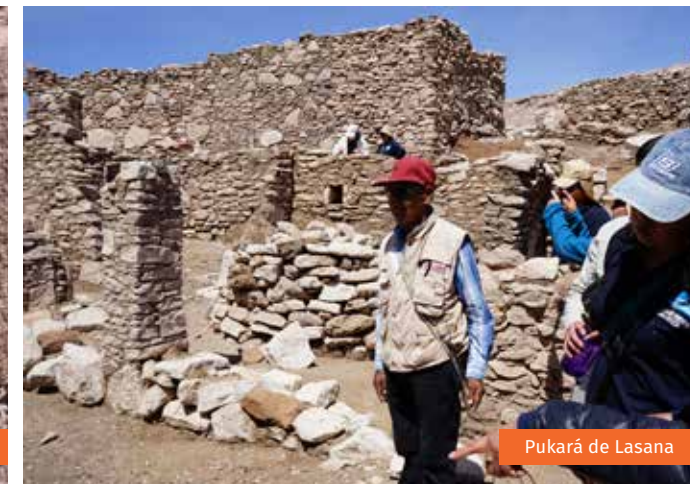
Pukará de Lasana