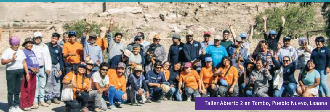
Taller Abierto 2 en Tambo, Pueblo Nuevo, Lasana