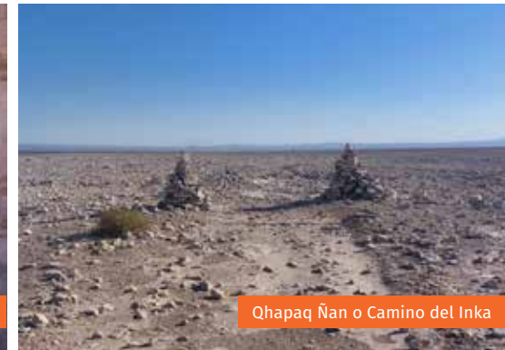
Qhapaq Ñan o Camino del Inka